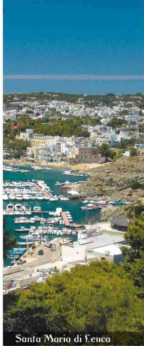
Santa Maria di Leuca