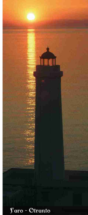
Faro - Otranto