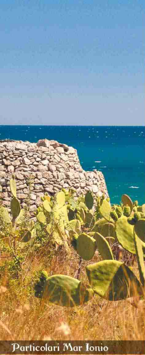
Particolari Mar Ionio